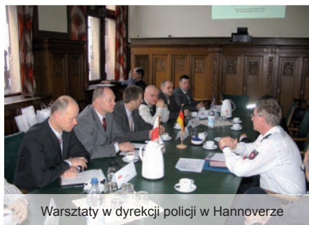
Warsztaty w dyrekcji policji w Hannoverze

Program „Uczenie się przez całe życie” Leonardo da Vinci