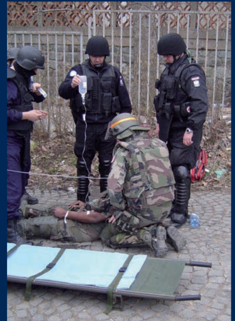
Ranny żołnierz francuski opatrywany przez polskich sanitariuszy