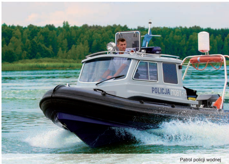
Patrol policji wodnej

W ramach imprezy zaplanowano liczne atrakcje w formie występów, wywiadów, czy też konkursów. Nie zabraknie pokazów przygotowanych przez funkcjonariuszy garnizonu kujawsko-pomorskiego, np.: pokaz ujawniania i zabezpieczania śladów linii papilarnych palców i dłoni, pokaz tresury psów służbowych, pościg nieoznakowanym radiowozem za niebezpiecznymi przestępcami. W trakcie pościgu funkcjonariusze Sekcji Antyterrorystycznej zaprezentują zatrzymanie pojazdu, obezwładnienie przestępców i ewakuację z rejonu działania. Jest to doskonała okazja do prezentacji policyjnego sprzętu specjalistycznego , m.in.: automatycznej wyrzutni gazów łzawiących, miotacza wody, ambulansu kryminalistycznego, radiowozów, motocykli i innych. Rozstrzygnięty zostanie plebiscyt –