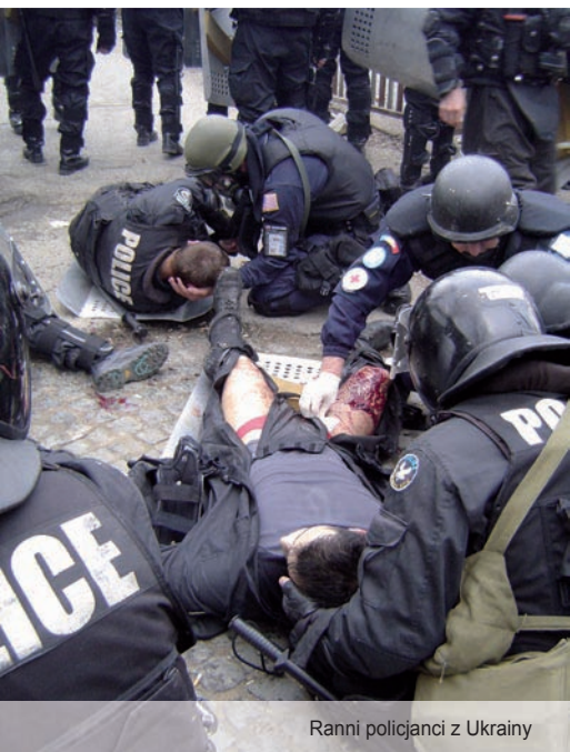
Ranni policjanci z Ukrainy

(zdjęcia wykonane 17 marca 2008 r. w czasie odbicia budynku sądu przez siły ONZ)