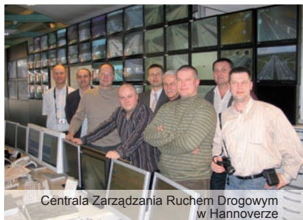
Centrala Zarządzania Ruchem Drogowym w Hannoverze

W czasie pobytu w jednostce policji regionu środkowej i zachodniej Brabancji w Tilburgu (Holandia), uczestnicy mieli okazję zapoznać się ze strukturą i organizacją pracy policji holenderskiej oraz jej doświadczeniami w zakresie współpracy z policją belgijską. Funkcjonariusze naszej jednostki odwiedzili instytucję o nazwie Veiligheidshuis („Bezpieczny Dom”), w ramach której działają przedstawiciele podmiotów odpowiedzialnych za zapewnienie bezpieczeństwa w regionie, m.in.: policji, prokuratury, Urzędu Miejskiego, kuratorium, służb