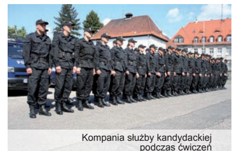
Kompania służby kandydackiej podczas ćwiczeń