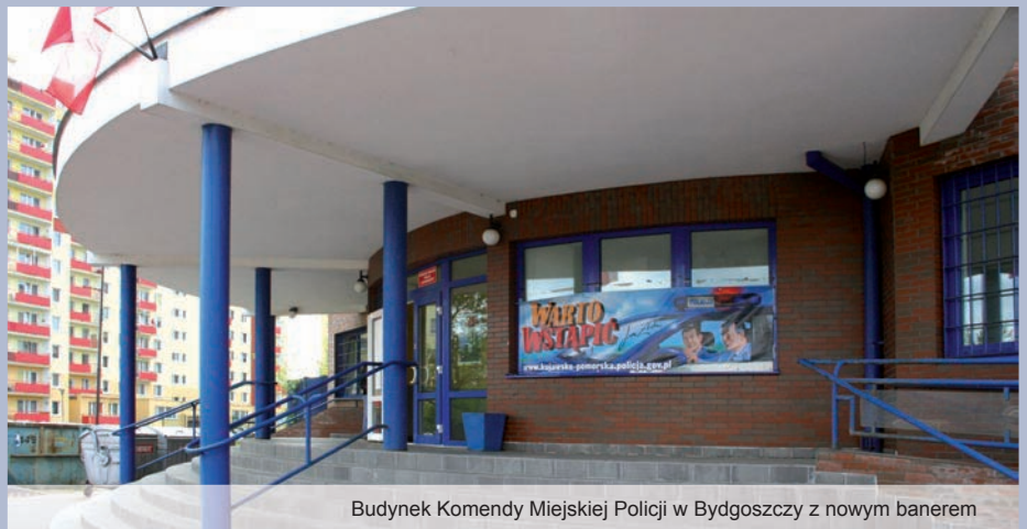
Budynek Komendy Miejskiej Policji w Bydgoszczy z nowym banerem