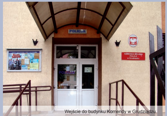
Wejście do budynku Komendy w Grudziądzu

Komenda Miejska Policji w Grudziądzu zdobyła certyfikat na trzy kolejne lata.