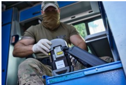
Szkolenie z zastosowania i obsługi Spektrometru Gemini