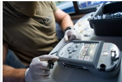
Szkolenie z zastosowania i obsługi Spektrometru Gemini