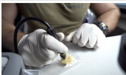
Szkolenie z zastosowania i obsługi Spektrometru Gemini