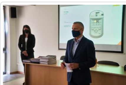
Szkolenie z zastosowania i obsługi Spektrometru Gemini

Autor: Izabela Adamczak-Garstecka Publikacja: st. sierż. Szymon Tworowski