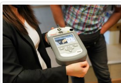
Szkolenie z zastosowania i obsługi Spektrometru Gemini