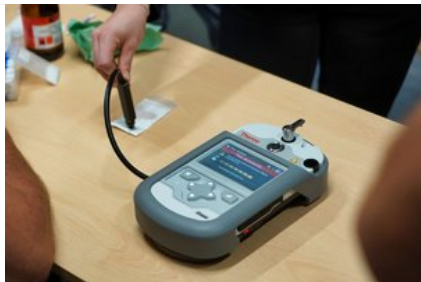
Szkolenie z zastosowania i obsługi Spektrometru Gemini