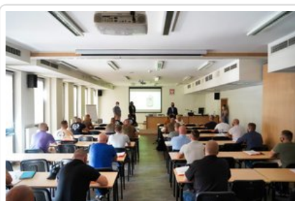
Szkolenie z zastosowania i obsługi Spektrometru Gemini