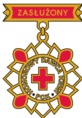
(dawniej II stopnia)