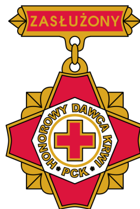
(dawniej III stopnia)