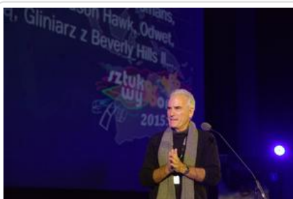
Gala „Sztuki wyboru – Kręcę na trzeźwo” #17