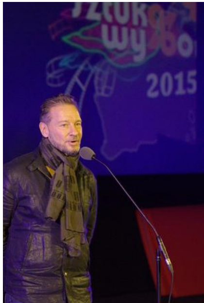
Gala „Sztuki wyboru – Kręcę na trzeźwo” #15