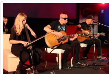
Gala „Sztuki wyboru - Kręcę na trzeźwo” #13