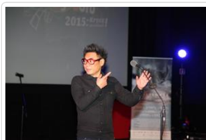
Gala „Sztuki wyboru - Kręcę na trzeźwo” #7