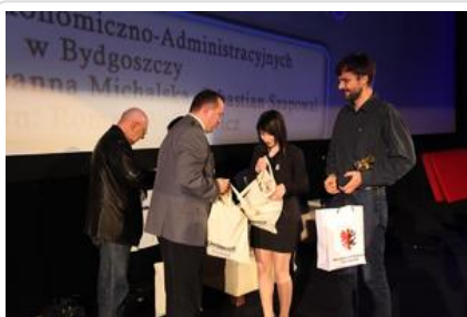
Gala „Sztuki wyboru – Kręcę na trzeźwo” #20