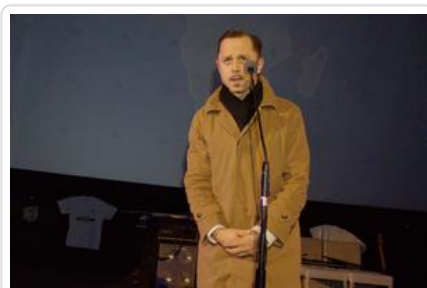
Gala „Sztuki wyboru - Kręcę na trzeźwo” #8