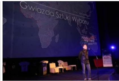
Gala „Sztuki wyboru – Kręcę na trzeźwo” #16