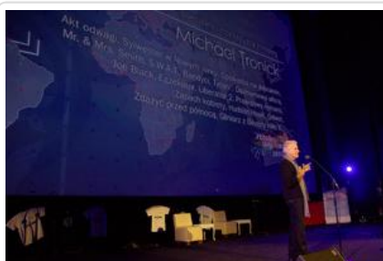
Gala „Sztuki wyboru – Kręcę na trzeźwo” #18