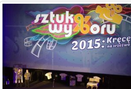
Gala „Sztuki wyboru - Kręcę na trzeźwo” #2