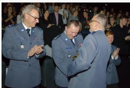
Gala „Sztuki wyboru – Kręcę na trzeźwo” #23