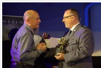
Gala „Sztuki wyboru – Kręcę na trzeźwo” #22