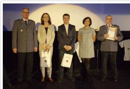
Gala „Sztuki wyboru – Kręcę na trzeźwo” #19