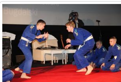
Gala „Sztuki wyboru - Kręcę na trzeźwo” #6