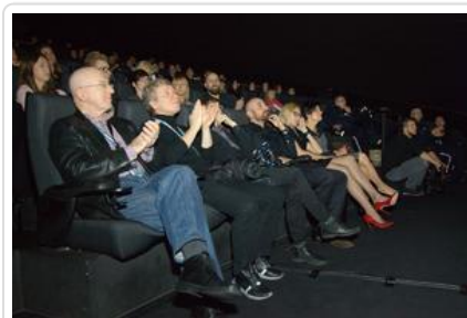
Gala „Sztuki wyboru - Kręcę na trzeźwo” #3