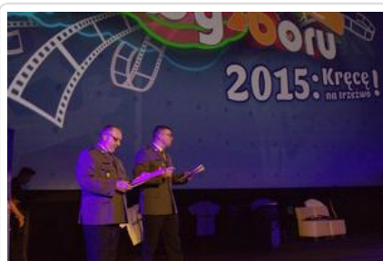
Gala „Sztuki wyboru - Kręcę na trzeźwo” #12