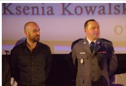
Gala „Sztuki wyboru – Kręcę na trzeźwo” #21