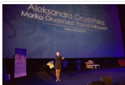
Gala „Sztuki wyboru - Kręcę na trzeźwo” #9