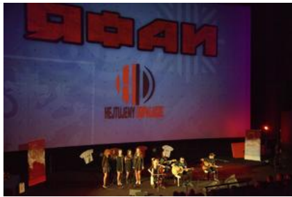
Gala „Sztuki wyboru – Kręcę na trzeźwo” #14