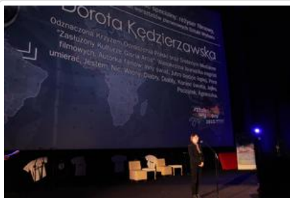
Gala „Sztuki wyboru – Kręcę na trzeźwo” #24