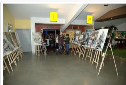
Gala „Sztuki wyboru - Kręcę na trzeźwo” #1