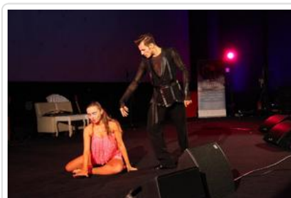
Gala „Sztuki wyboru - Kręcę na trzeźwo” #10