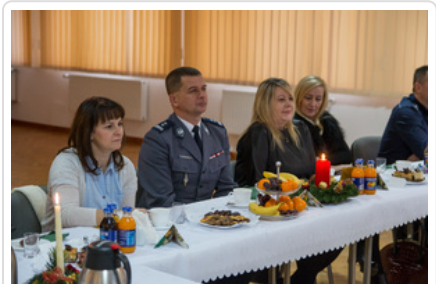
Wigilijne spotkanie #12