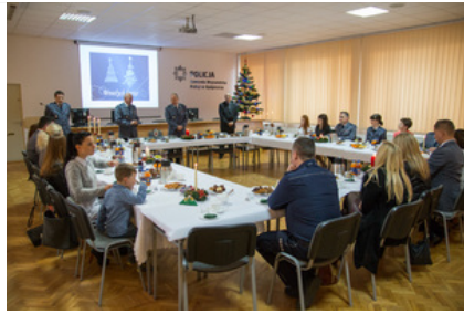
Wigilijne spotkanie #2