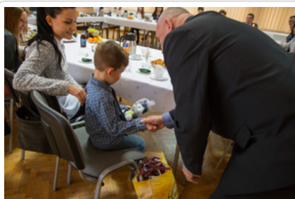
Wigilijne spotkanie #8