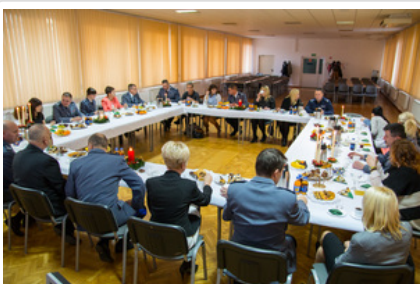
Wigilijne spotkanie #13