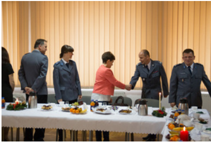
Wigilijne spotkanie #1