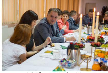
Wigilijne spotkanie #17