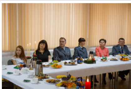
Wigilijne spotkanie #11