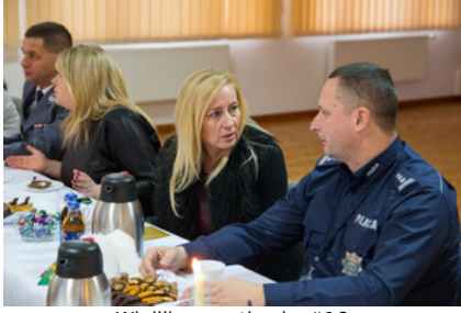
Wigilijne spotkanie #16