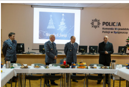
Wigilijne spotkanie #7