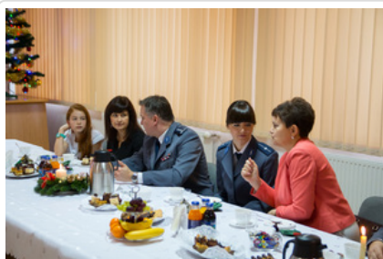
Wigilijne spotkanie #14