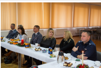
Wigilijne spotkanie #10