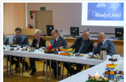
Wigilijne spotkanie #15