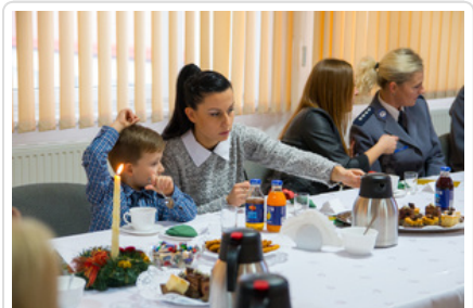
Wigilijne spotkanie #9