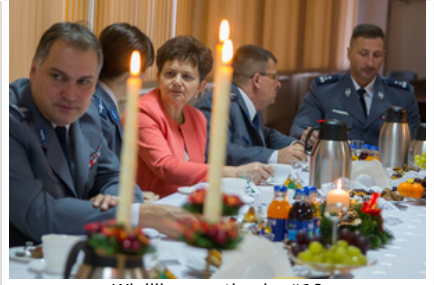
Wigilijne spotkanie #18