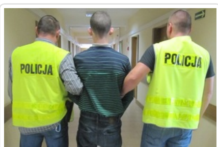
podejrzan o włamania

Autor: nadkom. Małgorzata Marczak Publikacja: Kamila Ogonowska