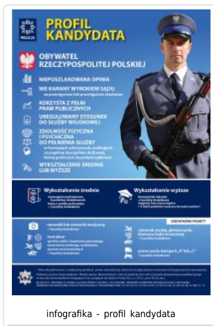
infografika - profil kandydata